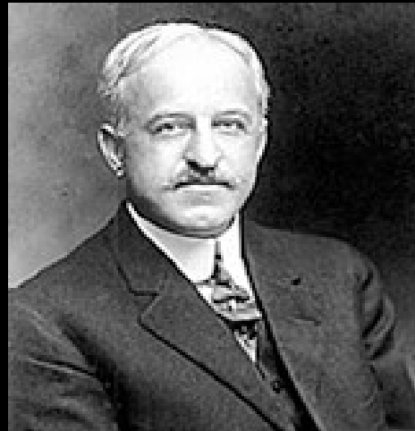
Samuel H. Kress