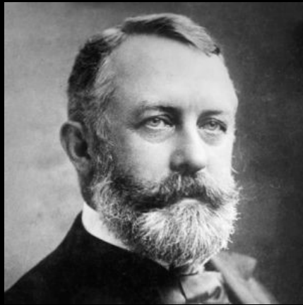
Henry Clay Frick