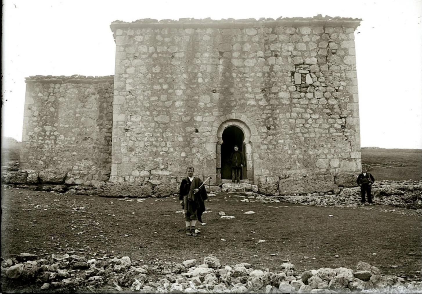
Fachada oeste con la puerta de acceso y el ábside de la Ermita de San Baudelio de Berlanga en Casillas de Berlanga (Caltojar, Soria). Hacia 1920.