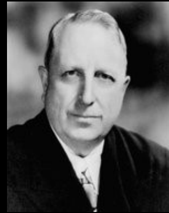
William R. Hearst.