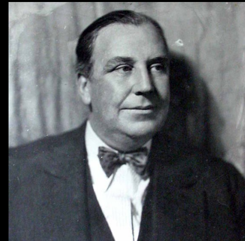
Addison C. Mizner