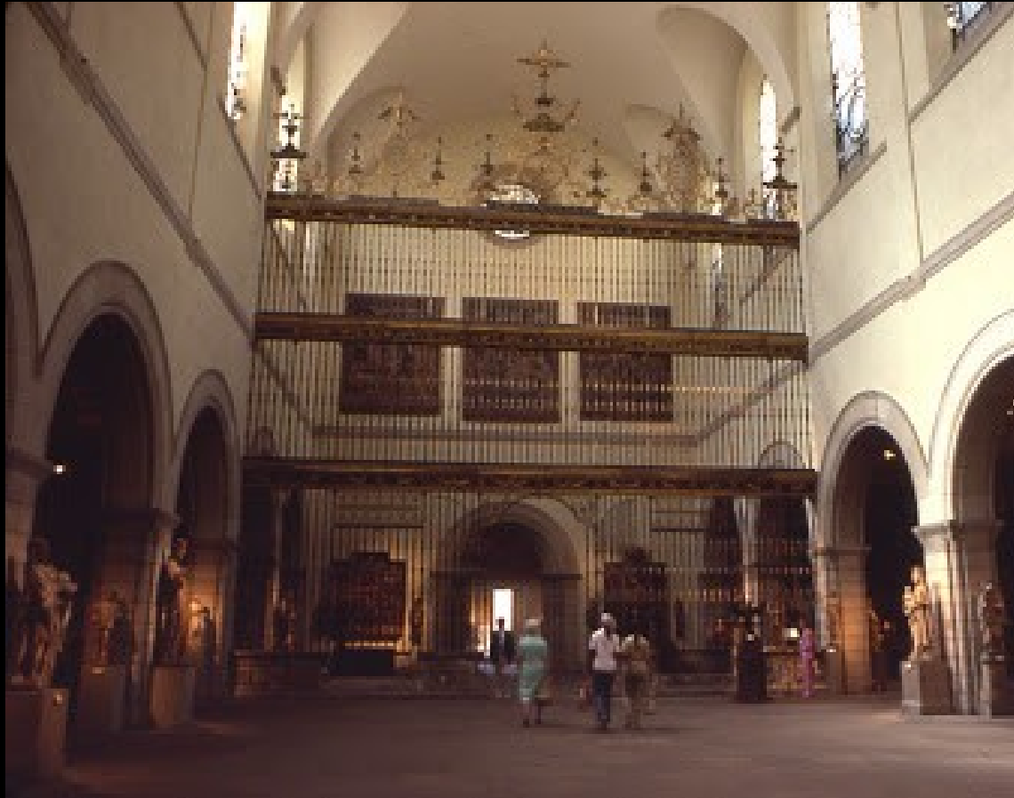
METROPOLITAN NUEVA YORK. REJA CATEDRAL DE VALLADOLID, 1763