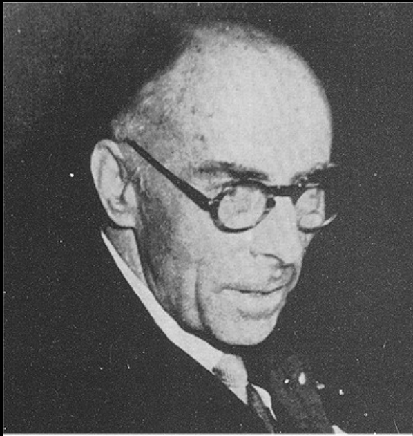
Leopoldo Torres Balbás (1888-1960)

Arquitecto, restaurador, arqueólogo, De la Real Academia de Historia. Correspondiente de la Hispanic Society of America de Nueva York