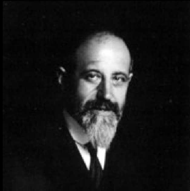
Elías Tormo (1869-1957)

Crítico de arte y literatura, jurista, historiador, arqueólogo y político. Ministro de Instrucción Pública y Bellas Artes con Berenguer